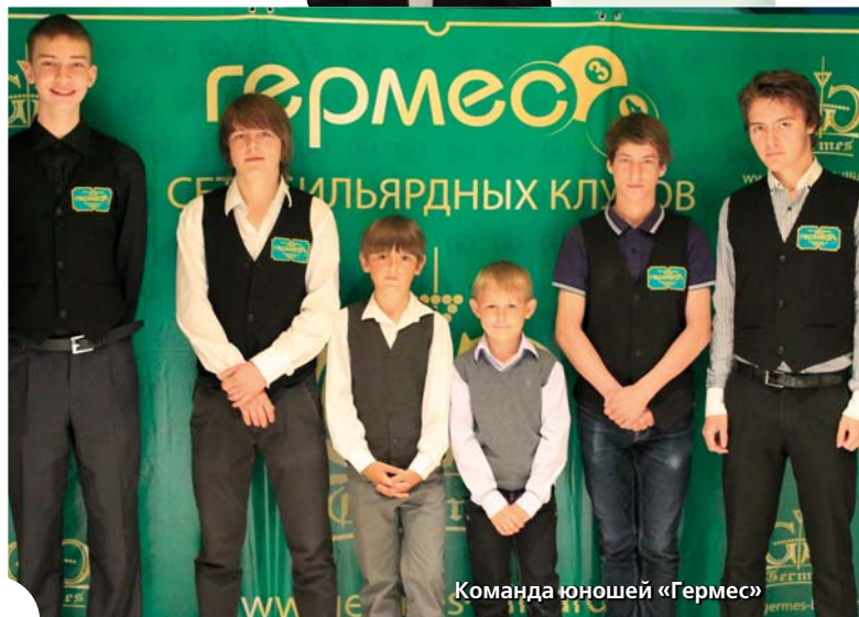
Команда юношей «Гермес»