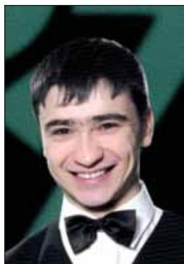
Юрий Пашинский 2002 и 2004 г.