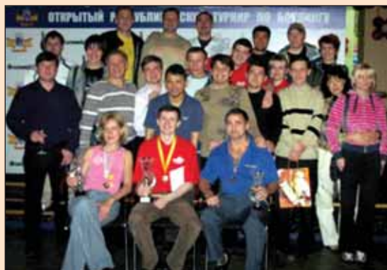
Схема турниров выстроена таким образом, что принять участие в них могут все желающие, независимо от пола и профессиональной подготовки. Главное - желание участвовать и испытать свои силы в настоящем чемпионате!

Республиканские турниры проводятся в "Бомбее" 2 раза в год, за время проведения турниров появились постоянные участники этих соревнований - любители боулинга из Казани, Самары,