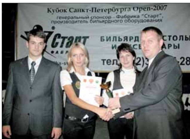
Кубок Санкт-Петербурга Open-2007 генеральный спонсор - Фабрика "Старт", производитель бильярдного оборудования