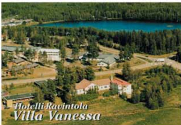
Hotelli Ravintola Villa Vanessa