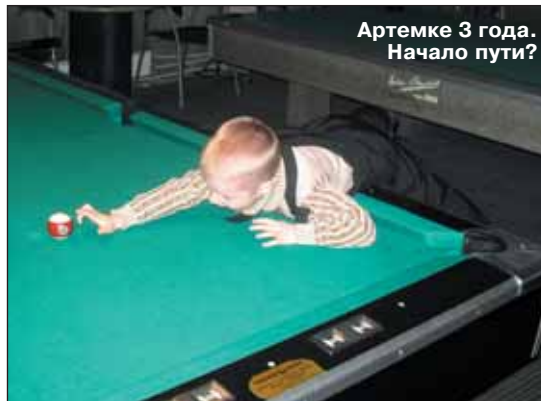
Артежке 3 года. Начало пути?

нашими традициями. Взять, к примеру, жеребьевку. Мне говорят, можно не “жеребить” регионы? А их не надо “жеребить” - рассеивать необходимо только призеров прошлого года. Такое правило существует во всей Европе, и нам не следует изобретать велосипед, а надо брать самое лучшее из уже давно придуманного и опробованного.