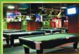
Гермес ТРК «Норд» метро «Пр. Просвещения», пр. Просвещения, д. 19 тел.: 333-31-20