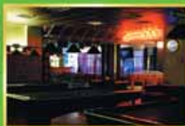
Гермес ТРК «Дыбенко» метро «Улица Дыбенко», пр. Большевиков, д. 18 тел.: 333-16-06