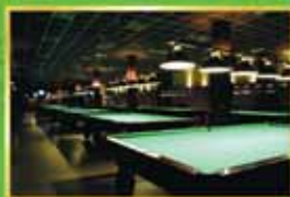
Гермес ТРК «Балканский» метро «Кутузов», ул. Балканская, д. 3 тел.: 333-29-48