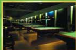
«Гермес» ТРК «Меркурий» Метро «Черная речка», ул. Сагушанка, д. 141 Тел.: 333-27-02