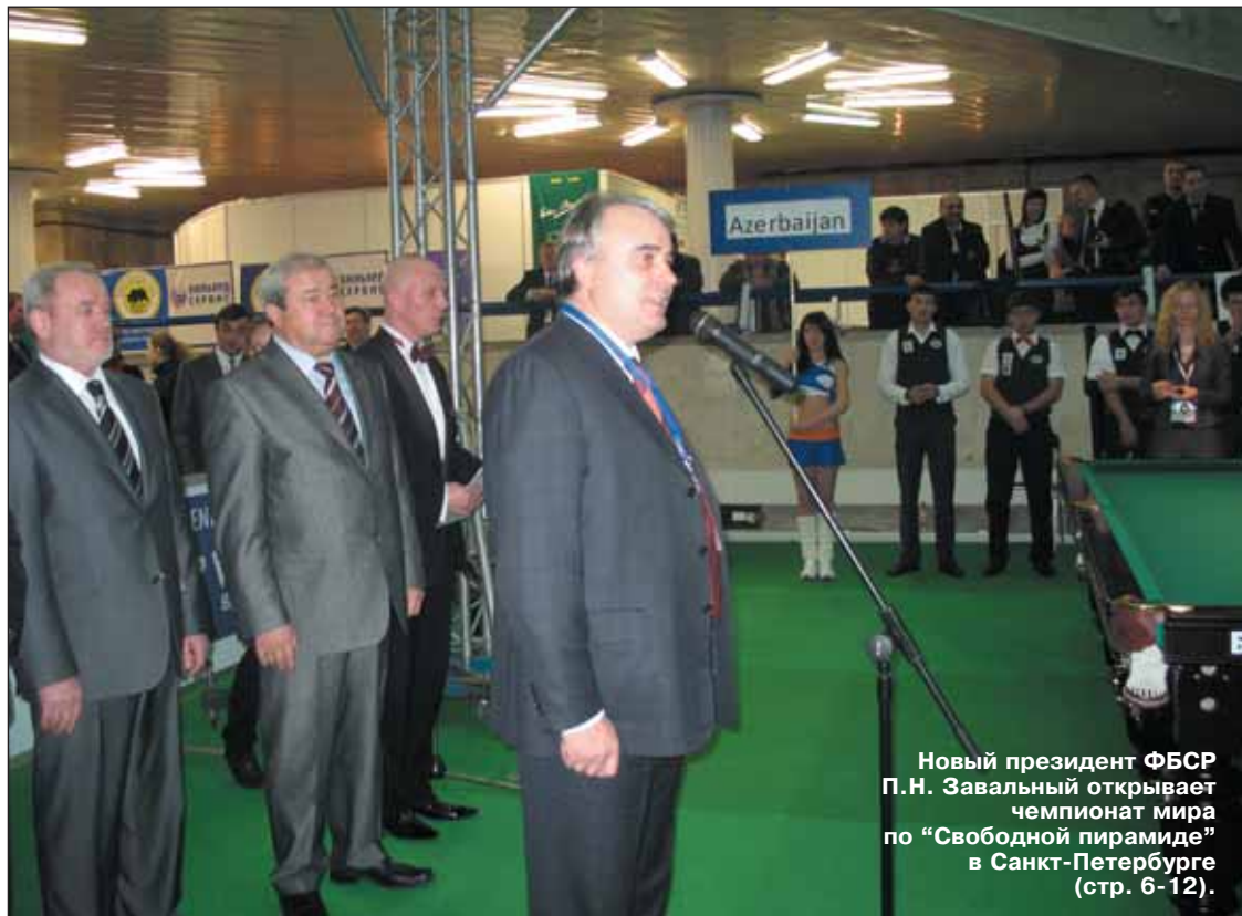
Новый президент ФБСР П.Н. Завальный открывает чемпионат мира по "Свободной пирамиде" в Санкт-Петербурге (стр. 6-12).

Отмечен высшими наградами ХМАО-Югра - премией "За выдающийся вклад в социально-экономическое развитие Ханты-Мансийского автономного округа", Знаком "За заслуги перед округом". Награжден Орденом Преподобного Сергия Радонежского.