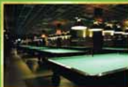
«Гермес» ТРК «Балканский» Метро «Лутчино», ул. Балканская, д. 5 Тел.: 333-29-48