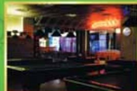
«Гермес» ТРК «Дыбенко» Метро «Улица Дыбенко», пр. Большевиков, д. 18 Тел.: 333-16-06