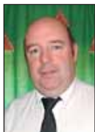
Джеймс ЛИСИ, председатель EBVA:

- От имени Европейской Ассоциации Бильярда и Снукера, я рад приветствовать всех игроков, рефери и гостей чемпионата в Санкт-Петербурге на этом бильярдном празднике, который был организован Федерацией бильярдного спорта России.