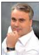
Павел ЗАВАЛЬНЫЙ, президент ФБСР:

- От имени Федерации бильярдного спорта России с большим удовольствием приветствую игроков, тренеров, судей, официальных лиц и болельщиков командного и юношеского чемпионатов Европы 2009 года.